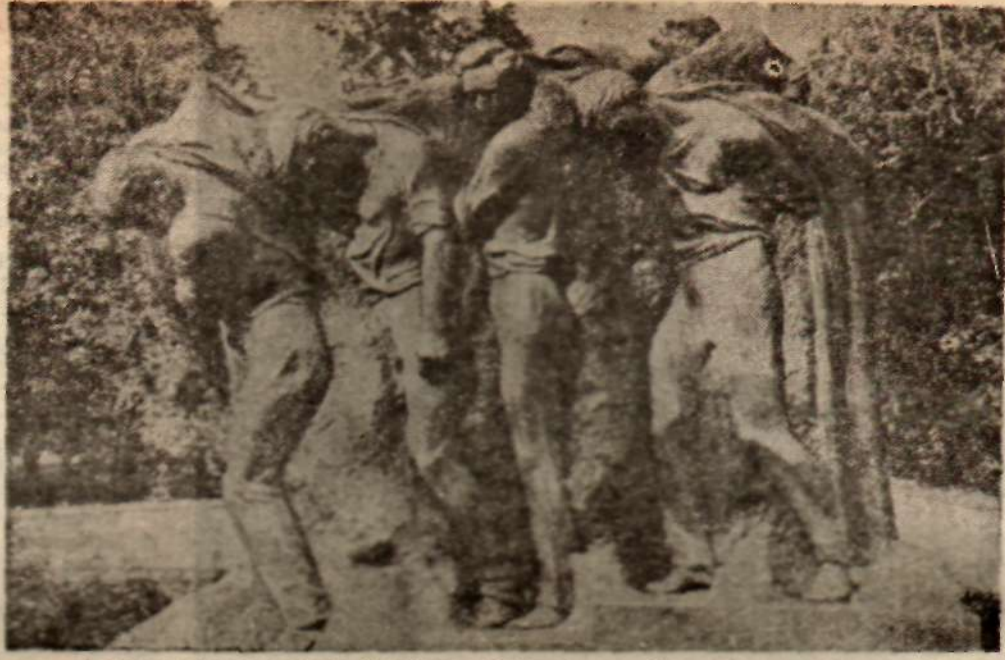
Lenin'in ölüsünü işçilerin Gorkly'den Moskova'ya nasıl taşıdıklarını gösteren anıt.

Benimkisi boş söz, sanki İstanbul'u tanıyor muyum gereğince. Moskova'nın kurucusu, XII. yüzyılın ortalarında tahta bir kale yaptırmış olan Yuri Dolgoruki'dir, şimdi Gorki caddesinin orada at üstünde heykeli var. Onun yaptığı kale, XIV. yüzyılda tuğlaya çevrilmiş, Moskova prenslerinin sarayı olan Kremlin'in duvarları XV yüzyılın son-