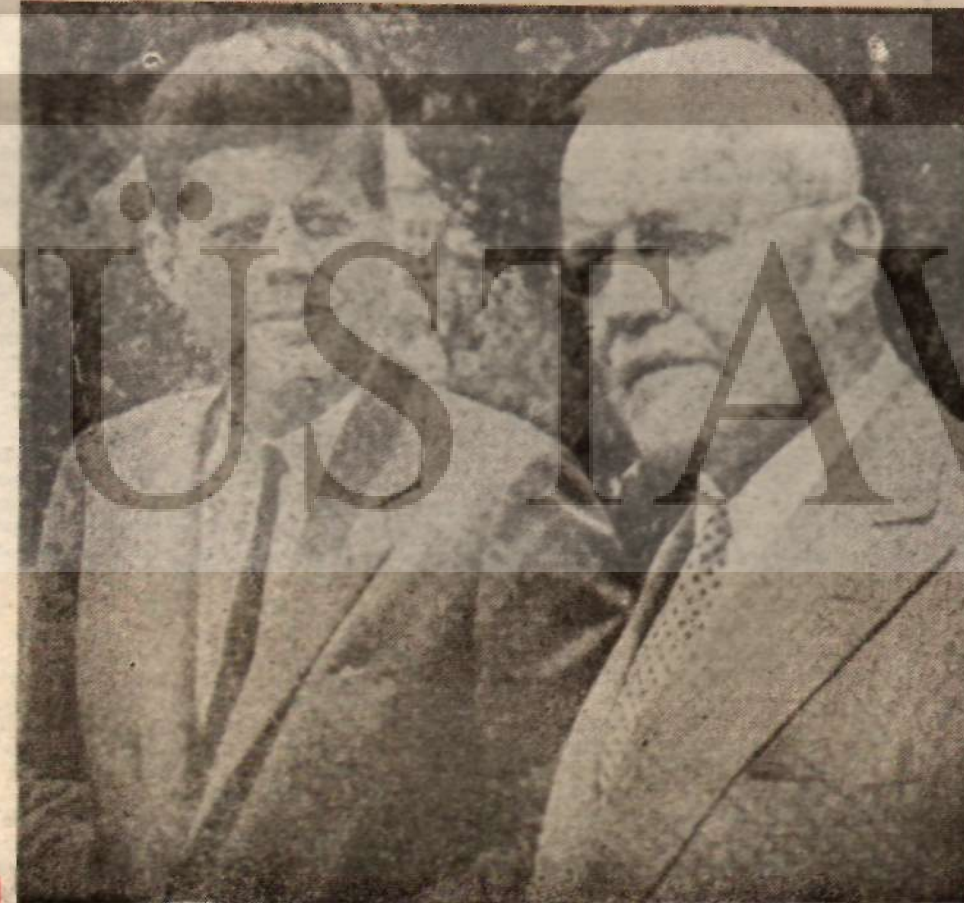
Başkan Kennedy, CIA Başkanı Allen Dulles ile Devlet içinde devlet!

Washington'daki CIA plâncıları, çıkartma için olarak başlangıçta, Havana'nın 282 mil Güney Doğusunda olan Trinidad kasabası civarını seçmişlerdi. Trinidad, liman olma, savunulması mümkün bir sahil teşkil etme, Castro'nun esas ordusundan uzak bulun-