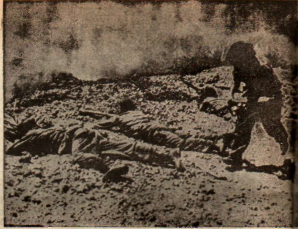
İstilâcıları Castro'nun mültecileri karşılamakta.

ma ve sığınmaya elverişli Escambray dağlarına yakınlık gibi avantajlara sahipti.