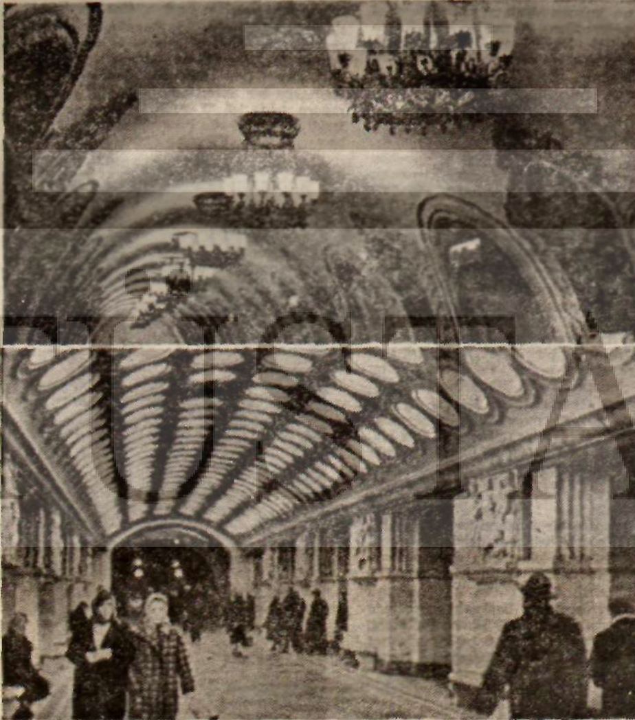
Moskova metrosundan iki görünüşü

Mezarlıktan çıktık, o günlerde Moskova'da bulunan Azerbaycanlı ozan Resul Rıza'ya akşam yemeğine davetliyiz, metro istasyonuna vullandık. Bu strada boşalan metrodan büyük bir kalabalık çıktı karşımıza. Bunlar kadınlı erkekli işçilerdi. Öğrendik ki orada bir stadymoda bir buz revüsü görmeye gidiyorlardı. Üstleri başları tertemizdi, kimi sandviçini yiyordu. On dokuzun-